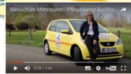
Mensch im Mittelpunkt - Pflegedienst Buchold & Eckert